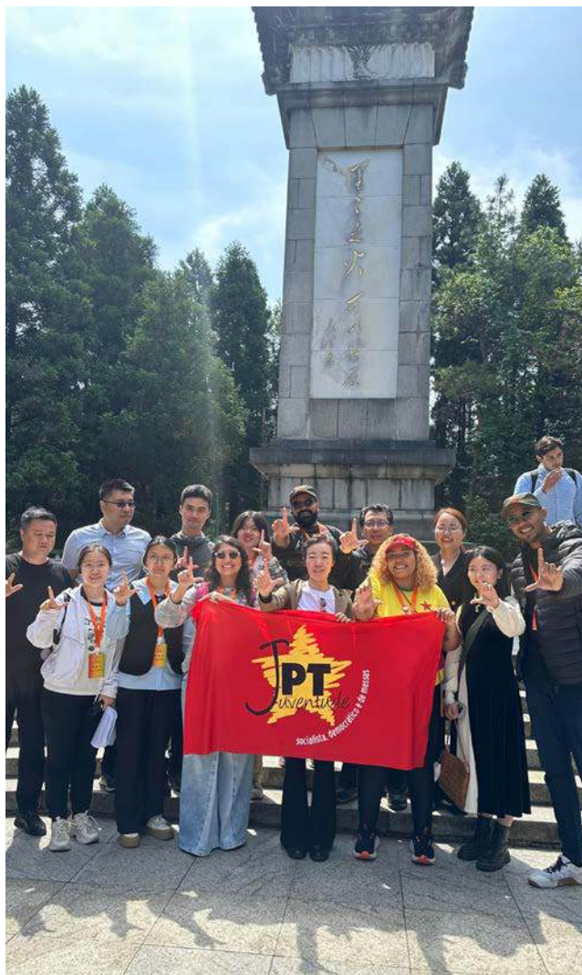
2025, Delegações da Juventude do PT e da Liga Nacional de toda a Juventude Chinesa em Jinggangshan

to maior no caso do Cáucaso do que do Oriente Médio.