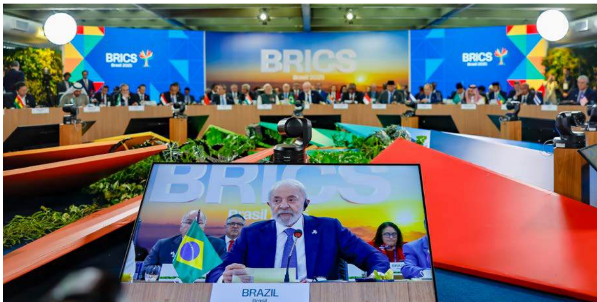
07.07.2025 - Presidente da República, Luiz Inácio Lula da Silva, durante a Sessão plenária “Meio Ambiente, COP30 e Saúde Global”, no Museu de Arte Moderna (MAM). Rio de Janeiro - RJ.

laram direitos fundamentais. Foi um período marcado pela instauração de ditaduras militares em diversos países — como Brasil, Chile e Argentina —, caracterizadas pela repressão sistemática à oposição, censura, perseguições políticas, tortura e desaparecimentos. Esses regimes, consolidados sobretudo a partir da década de 1960, estiveram inseridos no contexto da Guerra Fria e foram, em muitos casos, apoiados direta ou indiretamente por potências estrangeiras, especialmente pelos Estados Unidos, como parte de uma estratégia de contenção de projetos políticos considerados contrários aos seus interesses. Esses processos estiveram, portanto, articulados a interesses geopolíticos mais amplos, evidenciando que a democracia na região sempre esteve vinculada também à questão da soberania.