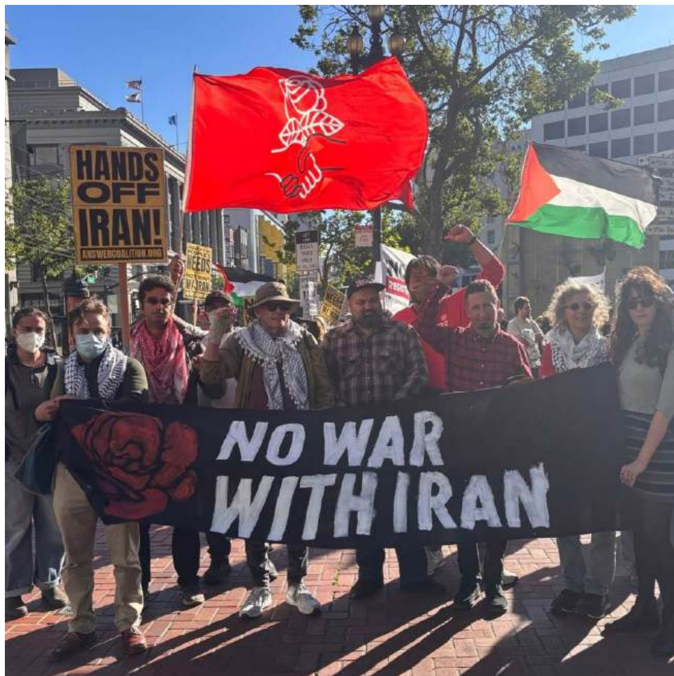
Manifestantes do DSA contra a guerra contra o Irã.

Continuar realizando intercâmbios bilaterais e cursos de formação política com os DSA, com o apoio técnico e programático da Fundação Perseu Abramo e do DSA Fund.