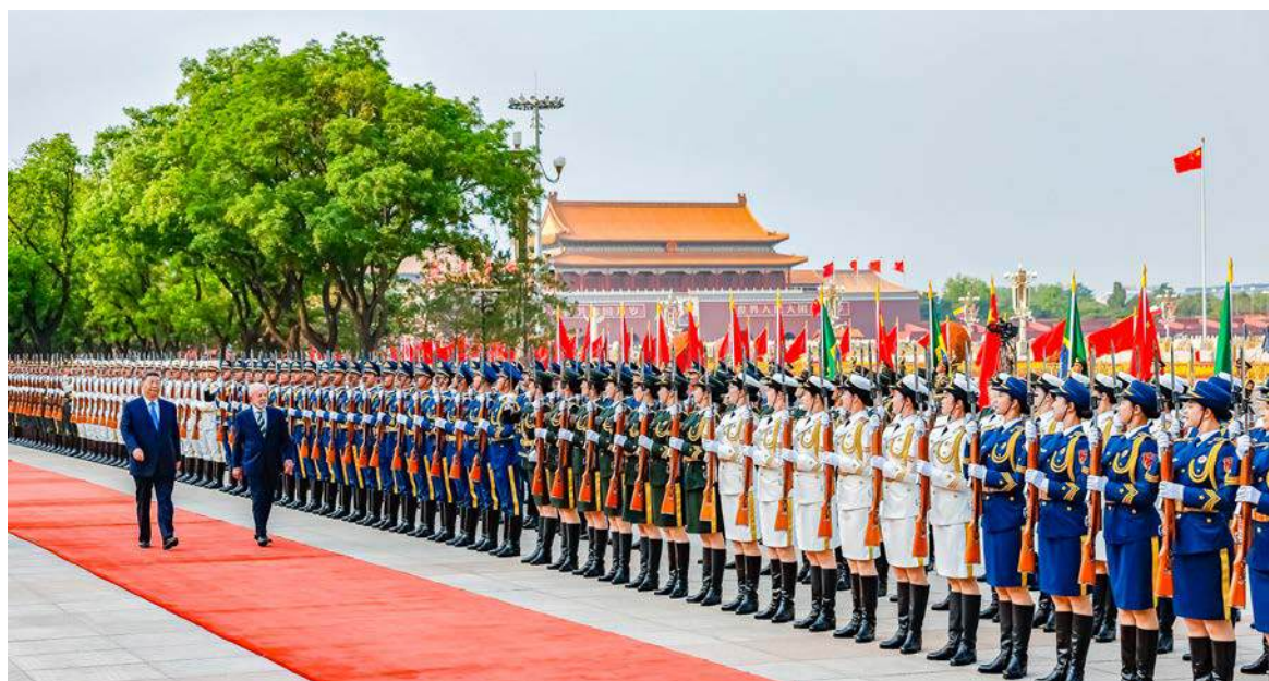
Maio de 2025. Presidente da República, Luiz Inácio Lula da Silva e o Presidente da República Popular da China, Xi Jinping, durante a cerimônia de boas-vindas, no Grande Palácio do Povo, Pequim - China.

O Partido dos Trabalhadores também deve dedicar maior atenção à Ásia Ocidental, com ênfase no Oriente Médio e na região do Cáucaso, aprofundando o conhecimento sobre a região quando houver pouco conhecimento sistemático acumulado, problema mui-