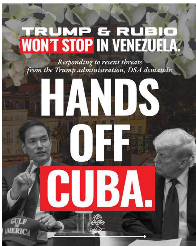
Cartaz do DSA contra as agressões de Trump contra à Venezuela e Cuba

Sob o comando de Donald Trump, o Estado estadunidense está envolvido, desde janeiro de 2025, em uma trajetória perigosa para seu povo, para os povos latino-americanos e para os povos de todo o mundo, na absoluta contramão do que se faz necessário para construir um mundo multipolar, equitativo, sustentável e pacífico.