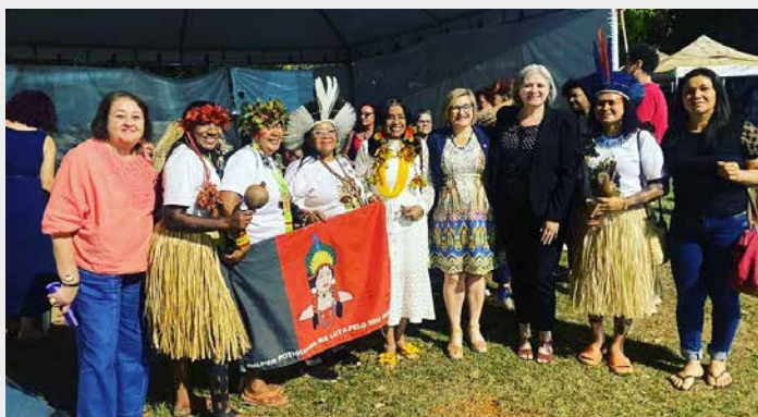
III MARCHA NACIONAL DAS MULHERES INDÍGENAS.

A segunda etapa envolverá os estados, os municípios que assinaram acordos de cooperação com o Ministério das Mulheres e a sociedade civil e os movimentos sociais. Acho que uma ação bastante objetiva é o pacto. E aí, já compondo também essa área de ampliação do atendimento às mulheres em situação de violência, inauguramos em um ano e meio do governo do presidente Lula duas Casas da Mulher Brasileira e também dois Centros de Referência da Mulher, tão importantes quanto as casas. Centros de referência, embora menores que as casas, fazem a diferença também na vida das mulheres, porque articulados com a patrulha Maria da Penha, com as delegacias da mulher, conseguem proteger e salvar vidas. Estamos em um processo