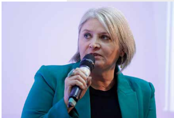
ENTREVISTA PARA A VOZ DO BRASIL

no Brasil. Segundo o Fórum Brasileiro de Segurança Pública, 1463 mulheres foram mortas por serem mulheres. Por que isso aconteceu?