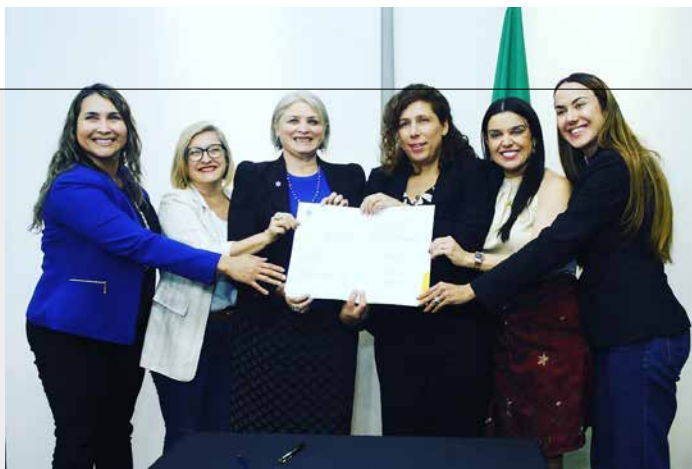
AÇÃO PARA APOIAR AS MULHERES EM SITUAÇÃO DE VIOLÊNCIA.

Importante citar algumas políticas transversais hoje que não enfrentam diretamente a violência contra as mulheres, mas trazem empoderamento e valorização. Foram investidos R$ 28 milhões do governo federal para