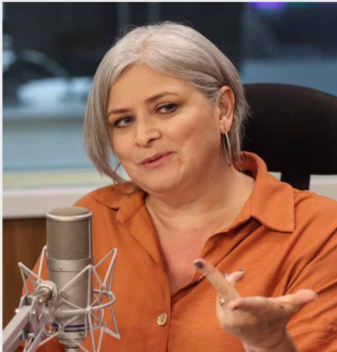
A SECRETÁRIA NACIONAL DE ENFRENTAMENTO À VIOLÊNCIA CONTRA MULHERES, DENISE MOTTA DAU, DO MINISTÉRIO DAS MULHERES.

A secretária Nacional de Enfrentamento à Violência Contra a Mulher do Ministério das Mulheres, Denise Motta Dau, aceitou o gigante desafio de assumir a pasta criada para melhorar os indicadores de violência de gênero, que se agravaram progressivamente nos últimos anos. “Em 2020 o Brasil teve 3.913 assassinatos de mulheres, dos quais 1350 foram registrados como feminicídios. Em 2023 o Brasil teve 1463 feminicídios. Dados estarrecedores do Anuário Brasileiro de Segurança Pública mostram que 61% das vítimas de estupro têm no máximo 13 anos, 10% possuem de 0 a 4 anos, são bebês, 17% têm de cinco a nove anos e 33% são meninas de 10 a 13 anos”, afirma ela.