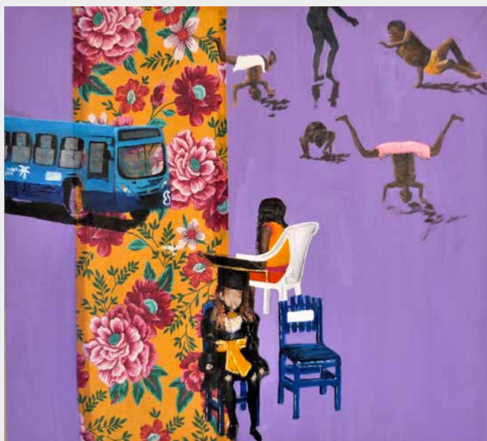
OBRA EM ACERVO DO BANCO DO NORDESTE.

Em julho de 2023 seu trabalho esteve na Pinacoteca do Estado do RN com a exposição Modos de Ver e Modos de Ser Visto, com curadoria de Sânzia Pinheiro e realização do Centro Cultural do Banco do Nordeste (CCBNB).