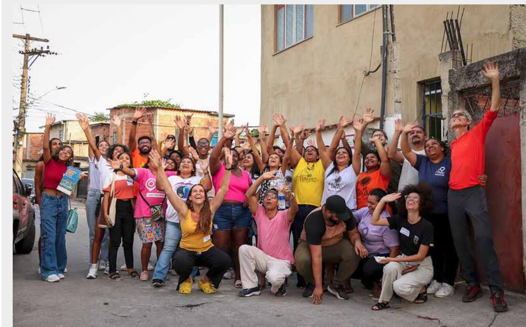
GRUPO DE MORADORES E A EQUIPE DA AMAC DIANTE DA SEDE.

mais afinada com as entidades como a que dirige, de forma a poder disputar os editais de projetos. Ela avalia que entidades nascidas do movimento social podem ajudar a fazer a ligação entre as políticas públicas e as pessoas que estão no território.