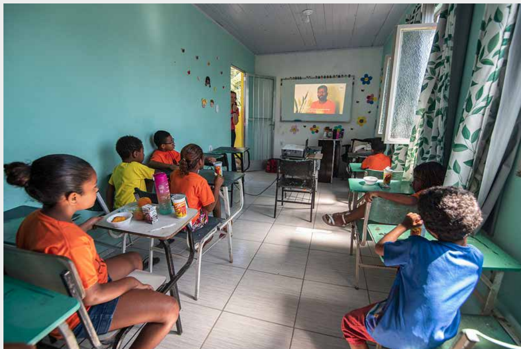
SALA DE AULA DA SEDE DO AMAC.