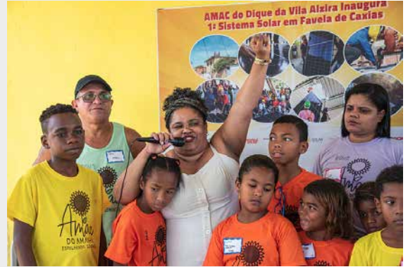
NILL NO DIA DA CHEGADA DOS PAINÉIS SOLARES

Nesse caminho, lançou-se em empreitadas con-