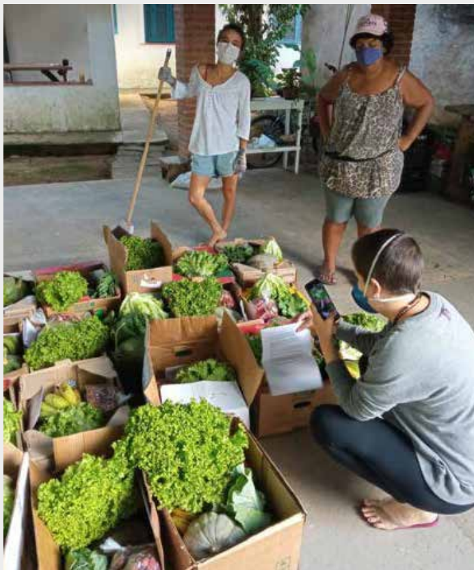
CESTAS DAS AÇÕES SOLIDÁRIAS REALIZADAS EM UBATUBA, NO LITORAL DO ESTADO DE SÃO PAULO.

dos Movimentos Populares (CMP), o Movimento dos Trabalhadores Rurais Sem Terra (MST), o Movimento dos Trabalhadores Sem Teto (MTST), centrais sindicais, partidos de esquerda ou articulações locais.