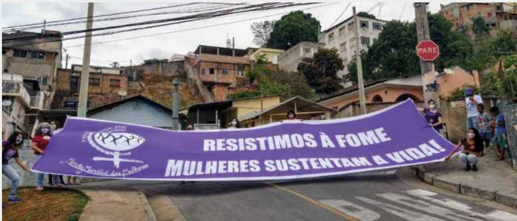
EM BELO HORIZONTE (MG), O ENCERRAMENTO DA 5ª AÇÃO INTERNACIONAL TEVE "MARMITAÇO" E INTERVENÇÃO COM FAIXA SOBRE A FOME.

vidas e territórios, gera o adoecimento das pessoas no médio e longo prazo. Por isso, a aposta pela organização a partir da agroecologia e da comida de verdade carrega consigo inúmeros significados políticos: a aposta pela coletivização do trabalho, pelo estreitamento dos vínculos comunitários, pelo cuidado consigo, com o próprio corpo e com o dos outros também, e pela saúde dos nossos territórios. ■