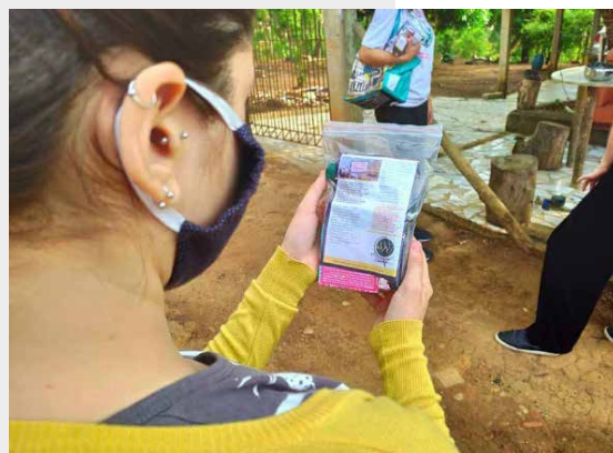
ACÇÃO SOLIDÁRIA NA COMUNIDADE VALE DO SOL, EM SÃO JOAQUIM DE BICAS (MG), REGIÃO ATINGIDA PELO ROMPIMENTO DA BARRAGEM DA MINERADORA VALE

Coletivizar o fazer da vida é também refletir em conjunto sobre as origens da desigualdade social, assim como a estrutural patriarcal e racista que estão imbricadas do modo de produção capitalista. No interior destas iniciativas criam-se também espaços de formação, debate e mobilização. Marcando presença nos territórios,