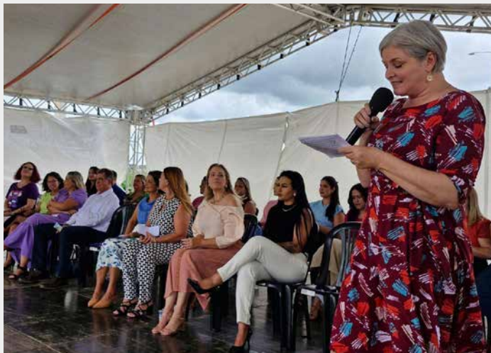
INAUGURAÇÃO EM PARCERIA COM A PREFEITURA DE CIDADE OCIDENTAL DE MAIS UM CENTRO DE REFERÊNCIA DA MULHER BRASILEIRA.

foco em uma visão familiar, estreita, da mulher exclusivamente como mãe e ou como parte de um casal de uma família heterossexual. Não com a visão de autonomia das mulheres, de empoderamento econômico e político das mulheres que garantisse maior autonomia, seja sobre o próprio corpo, seja sobre as demais decisões que afetam a sua própria vida. Isso veio junto com o corte em muitas políticas públicas sociais que também afetaram fortemente as mulheres, o que causou, além de uma pauperização maior e de um avanço grande na precarização do trabalho, também uma retirada de direitos. Podemos falar da