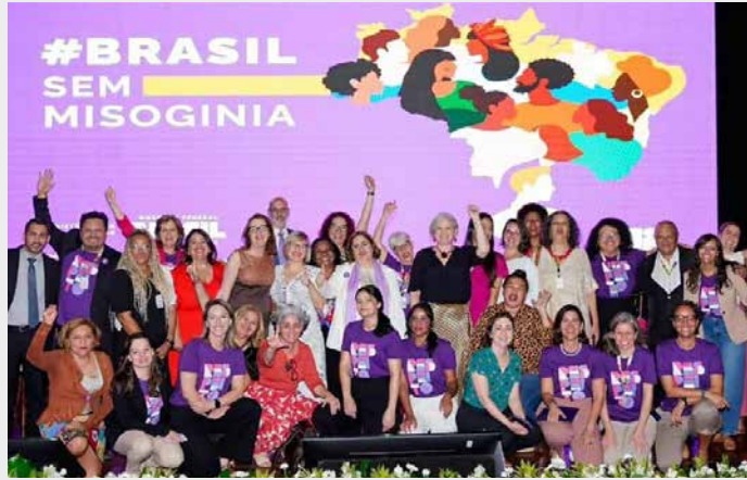
CAMPANHA BRASIL SEM MISOGINIA.

presidente Lula as bandeiras históricas das mulheres foram fortalecidas?