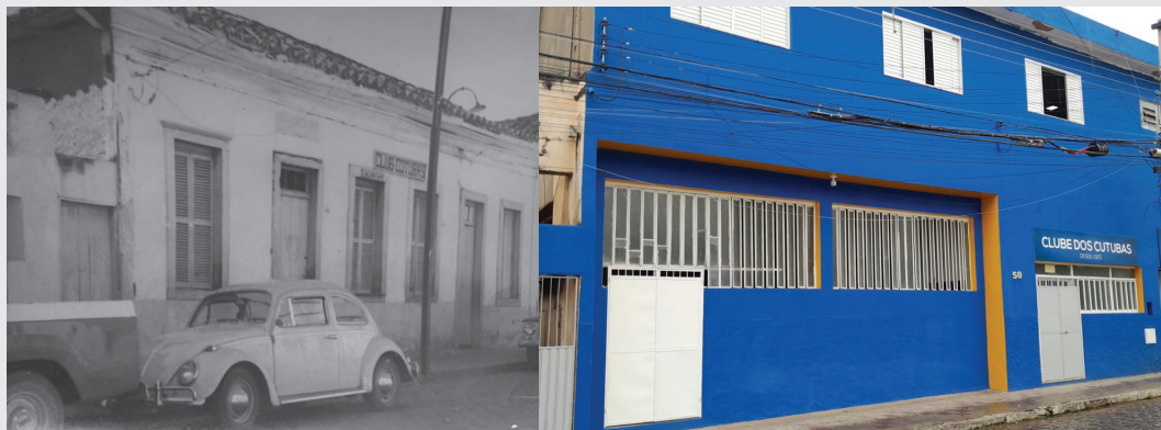
ESQUERDA: FACHADA DO CLUBE DOS CUTUBAS ANTES DA RESTAURAÇÃO, NA RUA 27 DE SETEMBRO, BEM NO CENTRO DE LEOPOLDINA (MG). DIREITA: PRÉDIO DO CLUBE RESTAURADO.

e o mestre-sala. “A gente dava uma volta lá dentro e saía. Mas na hora de namorar aquelas mulheres negras bonitas, o brancos corriam lá para o Cutubas”, recorda ele.