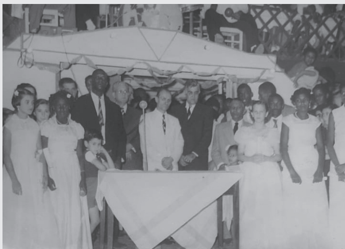
ELEIÇÃO DA RAINHA DOS CUTUBAS EM MEADOS DA DÉCADA DE 1950.

Velho (Sabará), Clube José do Patrocínio (Prata), Clube Palmeiras (Ituiutaba), Clube Princesa Isabel (Itabira), Clube Raça Negra (Frutal), Clube União (Araxá), Clube União (Patrocínio), Esporte Clube Biquense (Bicas), Associação Quilombo dos Palmares (Mar de Espanha), Liga Operária Beneficente de Ubá (Ubá), Clube Operário (São João Nepomuceno) e Elite