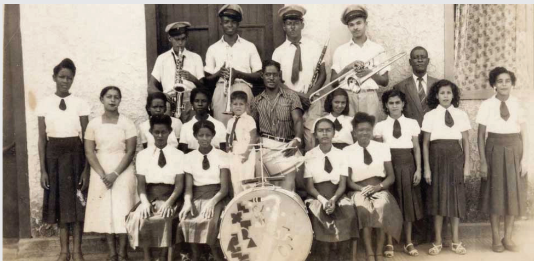
DÉCADA DE 40 - ESPERANÇA JAZZ E COMPONENTES DO CURSO DE CORTE E COSTURA DO CLUBE CUTUBAS.

Desde 2018, os clubes ou associações culturais e recreativas voltadas para integração e sociabilidade da comunidade negra, que divulgam e realizam manifestações culturais de origem africana e afro-brasileira, são considerados de relevante interesse cultural para Minas Gerais. Entre eles o Clube dos Cutubas, sediado em Leopoldina, na Zona da Mata, que foi fundado em 1925 e ainda hoje permanece em funcionamento.