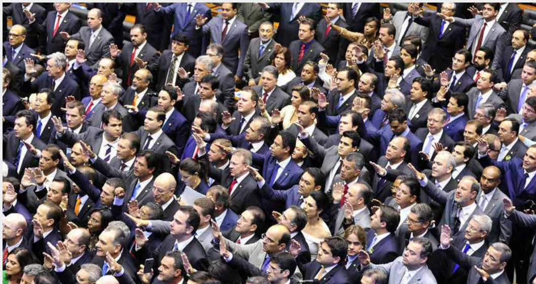
DEPUTADOS.