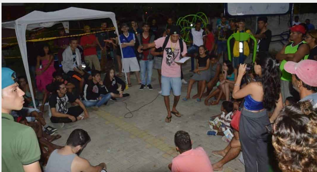
POETA CHORÃO DA BATALHA DO PEDREGAL, 2ª EDIÇÃO: 2019. PEDREGAL, CAMPINA GRANDE (PB).

A importância da Batalha da Quarentena para o Slam do Pedregal é tremenda, pois trata de um marco histórico para a poesia falada. Foi por meio desse movimento, modesto e sem grandes recursos, que se iniciaram as batalhas virtuais no Brasil. Com ela, passaram a interagir com outras comunidades e artistas, e a internet, então, virou um reduto de resistência poética que segue firme até que seja possível ocupar novamente as ruas.