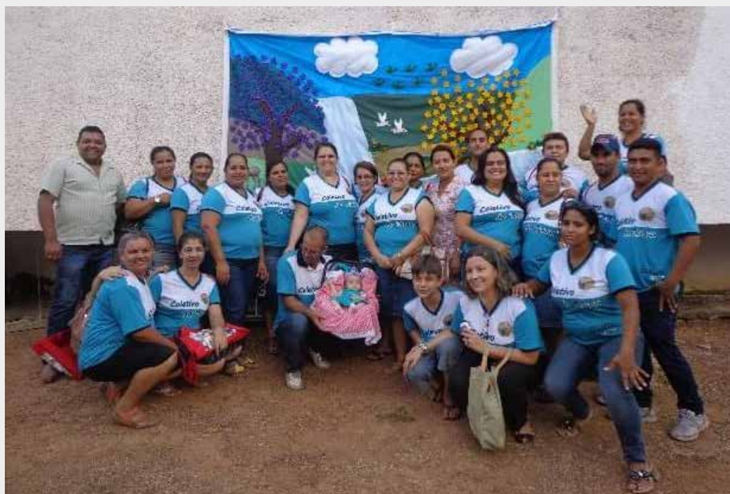
INTEGRANTES DO COLETIVO DA TERRA.

O Coletivo da Terra surgiu para formar professores do Mato Grosso com a perspectiva de valorização do conhecimento tradicional das comunidades quilombolas, indígenas e assentados presentes no território, apesar de viverem cercados pelo modelo de produção do agronegócio. A proposta é promover uma formação preocupada com a agricultura familiar sustentável.