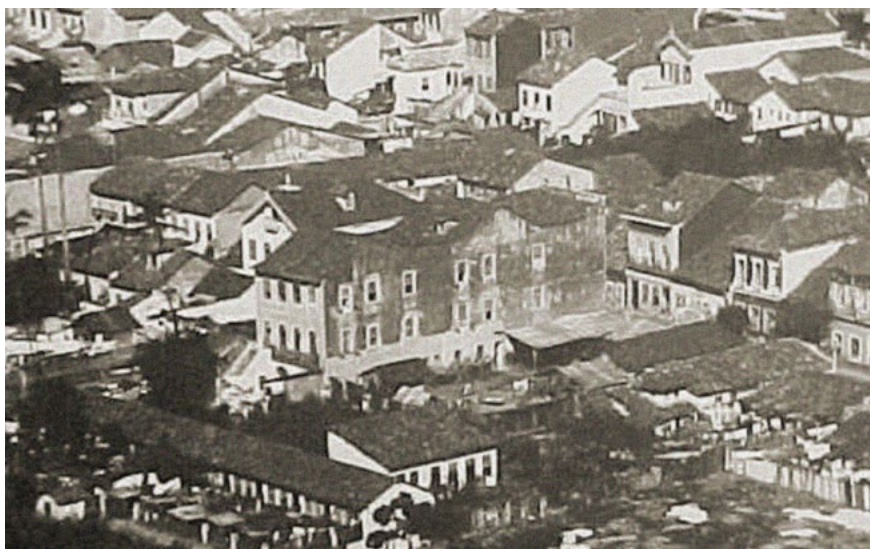
Imagem 1 – Cortiço cabeça de porco 6 .

da cidade e se tornou um importante região de concentração de trabalho com a construção da Central do Brasil, em 1858”.