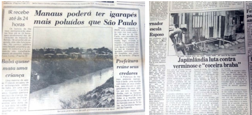
Figura 2. Igarapé do Franco, na Zona Oeste de Manaus, bairro da Compensa sendo poluído com casas em sua orla que nele despejavam água servida, além de serem usados como latrinas, já que não existia saneamento básico nenhum. Figura 3. Matéria do Jornal A Notícia , 03 de janeiro de 1984, mostrando a falta de saneamento básico no bairro da Japiimlândia em Manaus.