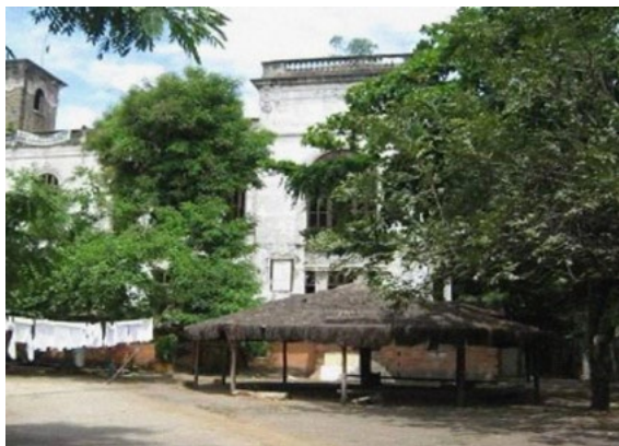
Imagem 4 – Aldeia Marakanã, na capital Rio de Janeiro, RJ 10

Em São Paulo, hoje considerada a maior metrópole da América Latina, temos uma conjuntura ainda maior. No que tange aos indígenas em contexto urbano, vale ressaltar, aqui, que São Paulo é bem conhecida entre os movimentos indígenas por vários motivos. Os nomes que compõem a cidade, como bairros, ruas e, em âmbito maior, as várias cidades do estado de São Paulo, possuem, em sua identidade regional, vários nomes cuja origem é indígena. São Paulo, por anos a fio, fora conhecida como Piratininga , ou São Paulo de Piratininga , e isso se deu pelo fato de aquela região ter sido território indígena de vários povos muito antigos e cheios de raízes, tradições e cultura, estas que, com o tempo e a chegada dos invasores colonizadores, foram parcialmente destruídas e dizimadas, o que configura um etnocídio.