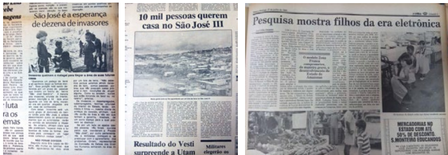
Figura 4. Crianças brincando em meio a terreno invadido no bairro do São José 2. Figura 5. Manchete mostrando a nova ocupação do chamado de São José 3. Figura 6. Crianças vendendo sacolas na feira livre de Manaus, apesar dos lucros das empresas dos últimos cinco anos.

No começo dos anos de 1990, Manaus, assim como todo o Brasil, sofria as consequências de planos econômicos fracassados. Sistema educacional falido e desemprego em massa, principalmente nas linhas de montagem do Distrito Industrial, alcançando grande parte da população, sendo notadamente os jovens de periferia de Manaus os mais atingidos por esta situação, por fazerem