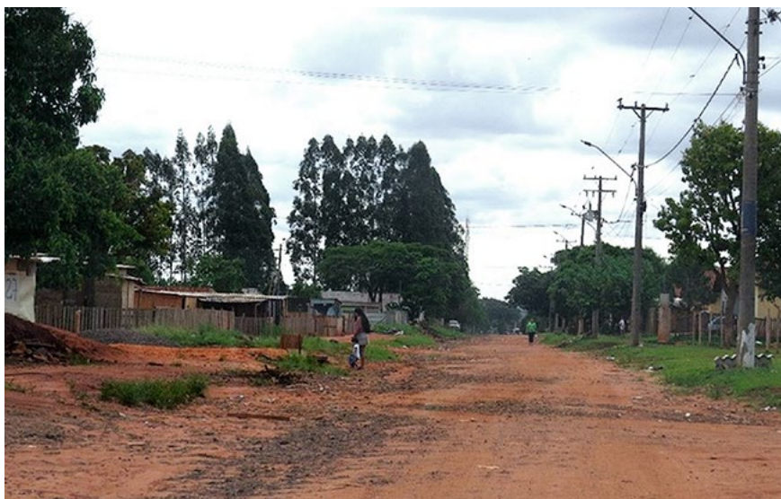
Figura 2 – Campo Grande: assentamento Indígena Estrela do Amanhã no Bairro Jardim Noroeste (2020). Segundo Batistoti e Latosinski (2019), o assentamento data de 2011 e é composto por três etnias: Terena, Guarani e Kaiowa. Atualmente, são 48 barracos erguidos ao lado da Aldeia Urbana Darcy Ribeiro, construída a partir dos movimentos indígenas por melhorias nas políticas públicas habitacionais em Campo Grande, entre os anos 2003 e 2007.

Nessa perspectiva, Campo Grande se revela na forma urbana da fragmentação, com função expropriativa na reprodução social e sob uma estrutura hierarquizada no valor de troca e na propriedade. Estas, forma, função e estrutura, quando compreendidos a partir dos nexos de interseccionalidade, contribuem para ampliar a análise dos processos socioespaciais de periferação, espoliação e segregação, especialmente considerando os bairros Vila Nasser e Jardim Noroeste (Figura 2).