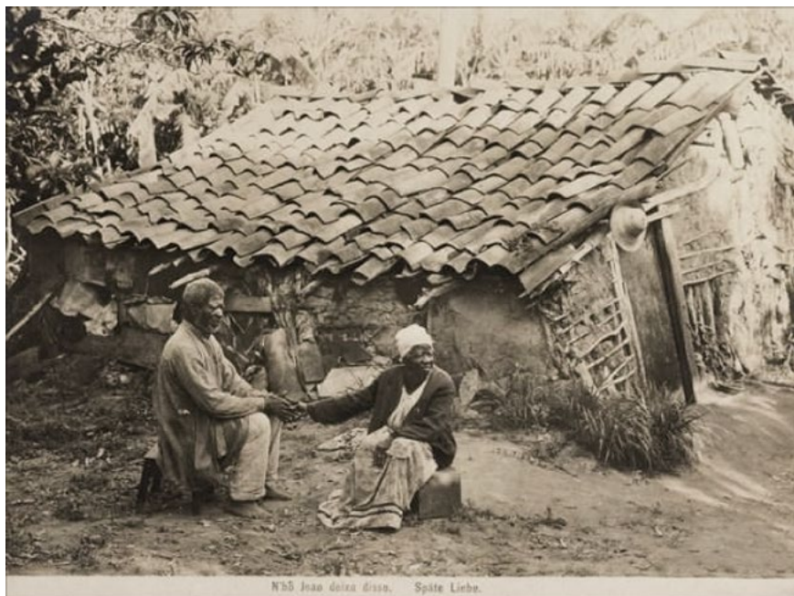
Imagem 2 – Livro da Editora Humanitas mostra o cotidiano dos negros no Rio de Janeiro no início do século XX 7

ponto este fenômeno nas cidades nos atinge atualmente, é preciso refletirmos para que a plena cidadania seja a mais plena possível.