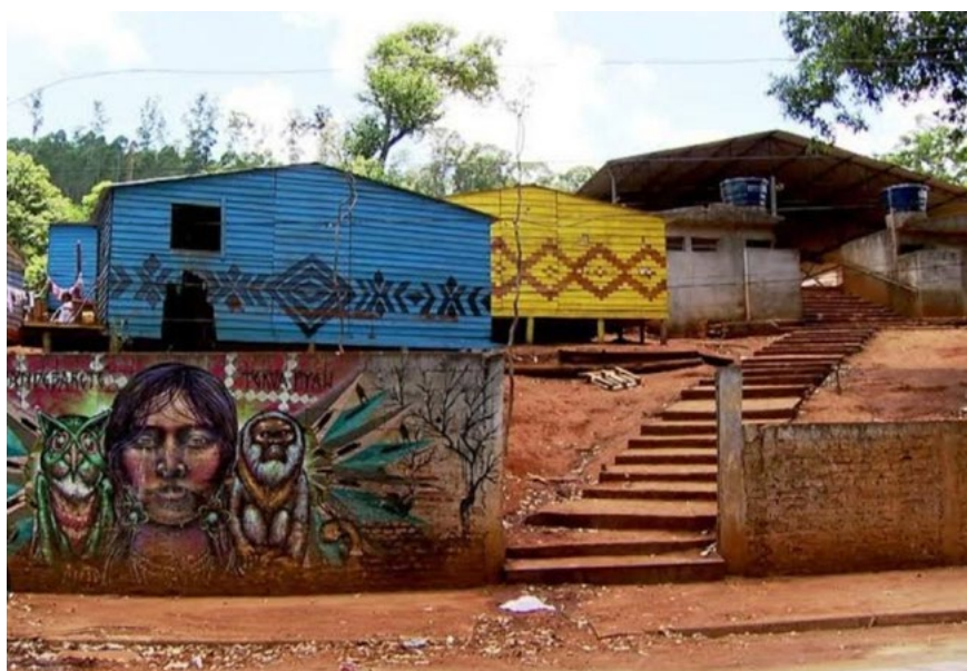
Imagem 5 – Aldeia indígena do Jaraguá, na Zona Norte de São Paulo 11 .

Para além da ótica que compõe as favelas do Brasil, o Pico do Jaraguá também é um lugar ancestral e que abriga várias famílias oriundas de povos indígenas que habitavam aquela região e que quase foi mais uma vítima da especulação imobiliária – que assola aquela região até os dias atuais. O Pico do Jaraguá é conhecido como um lugar de forte resistência, de luta violenta contra as grandes construtoras que sonham em invadir aquele lugar para grandes construções, assim como uma parcela favorável de São Paulo.