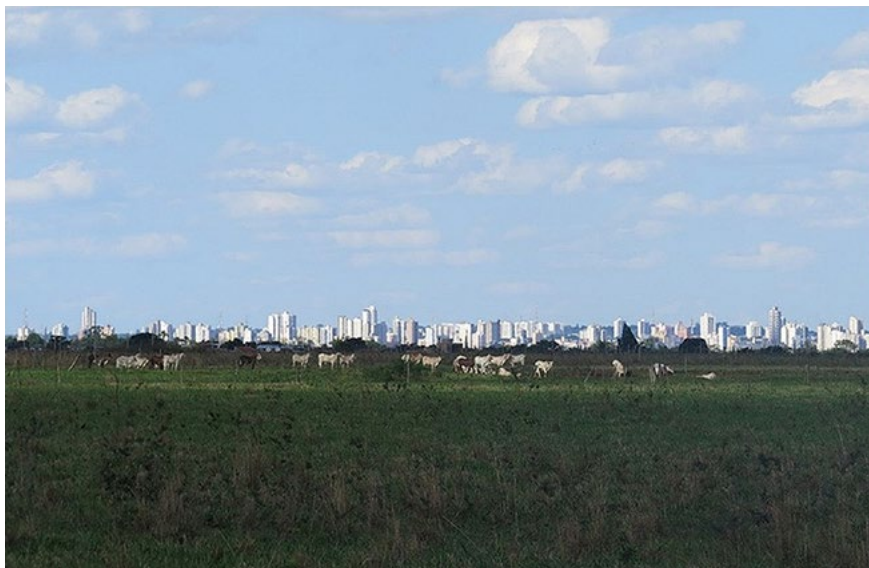
Figura 1 – Às margens da BR-262, em primeiro plano, fazenda de gado no município de Campo Grande. Em segundo plano, vista parcial da área urbana (2020). Chama-se a atenção, a partir desse quadro da realidade urbana de Campo Grande, para a configuração espacial da cidade e os conteúdos do fenômeno urbano como possibilidade de ampliação das fronteiras de reprodução do capital: a forma urbana como materialidade das relações sociais de produção e a ‘fronteirização’ das estruturas produtivas.