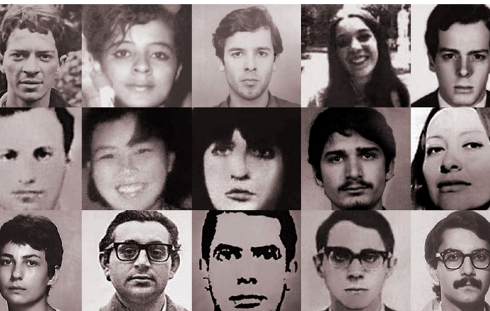
Memorial da Resistência de São Paulo - Arte: Renan Braz

Homenagem aos estudantes da FFLCH busca promover justiça e reparar a violência de tortura, de morte e de desaparecimento que eles passaram