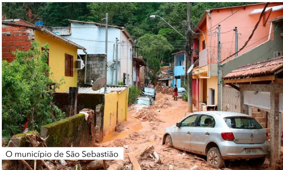
O município de São Sebastião