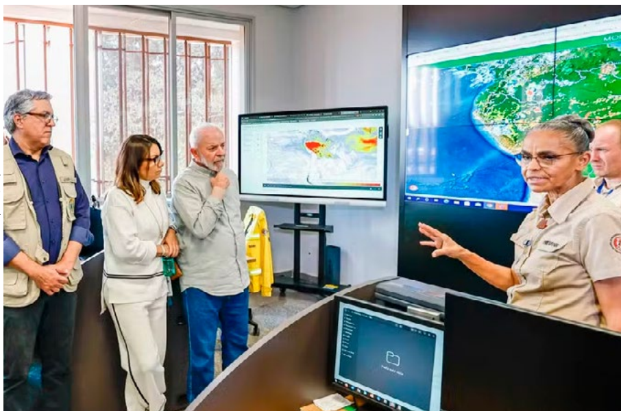
Lula durante visita à Prevfogo, na sede do Ibama, ao lado de Marina Silva, em Brasília

do o desmatamento em 45,7% de agosto de 2023 a julho deste ano, estaria uma situação incomparavelmente mais difícil”, disse Marina referindo-se a dados da área sob alertas de desmatamento medidos pelo sistema Deter, do Inpe.