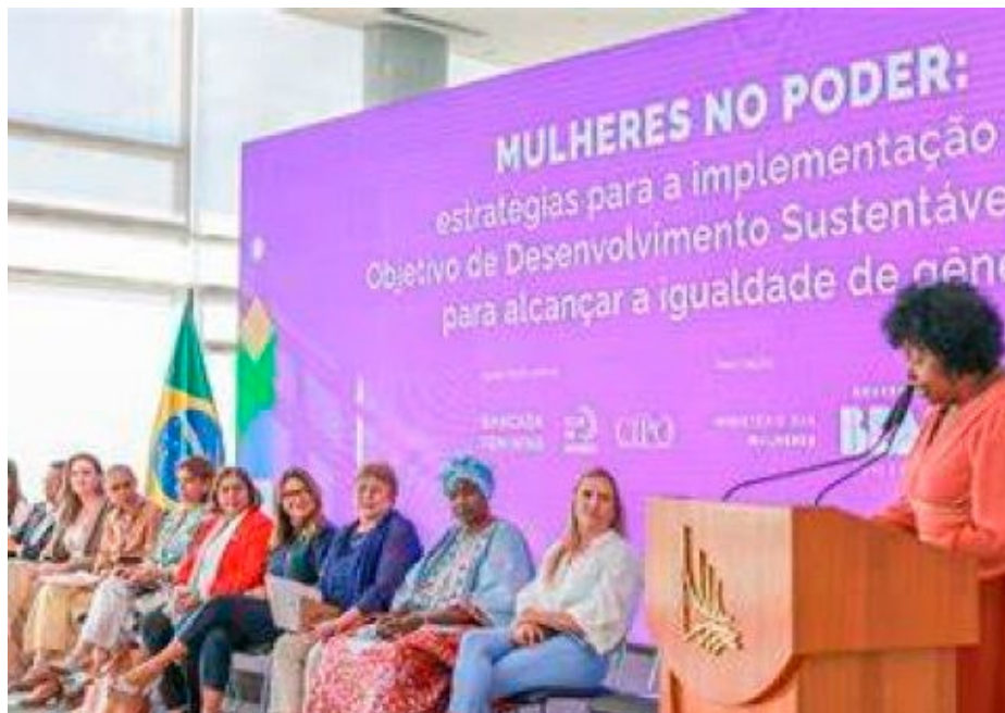
Joedson Alves/Agência Brasil

A campanha Mais Mulheres no Poder, Mais Democracia, lançada pelo Ministério das Mulheres, tem como foco a ampliação da participação de mulheres, em toda sua diversidade e pluralidade, nos espaços de poder e de decisão e no enfrentamento à violência política de gênero, com