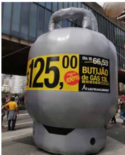
A estrela dos atos de 2 de outubro

flete “parte da elevação nos patamares internacionais de preços de petróleo, impactados pela oferta limitada frente ao crescimento da demanda mundial, e da taxa de câmbio, dado o fortalecimento do dólar em âmbito global”.