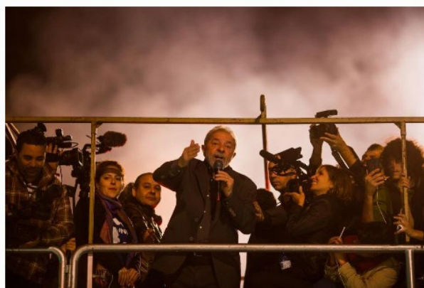
Former President Luiz Inacio Lula da Silva during protest against interim President Michel Temer.... [+]

I write about global business and investing in emerging markets.