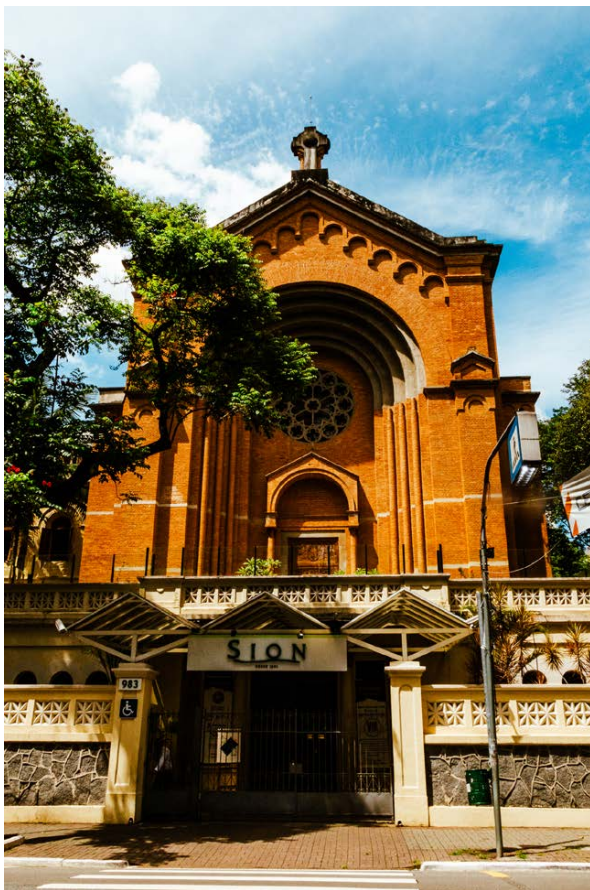
Fachada atual do Colégio Sion.