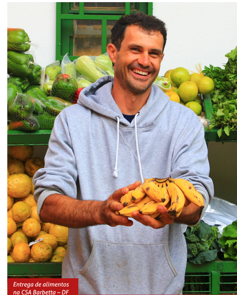
Entrega de alimentos na CSA Barbetta – DF