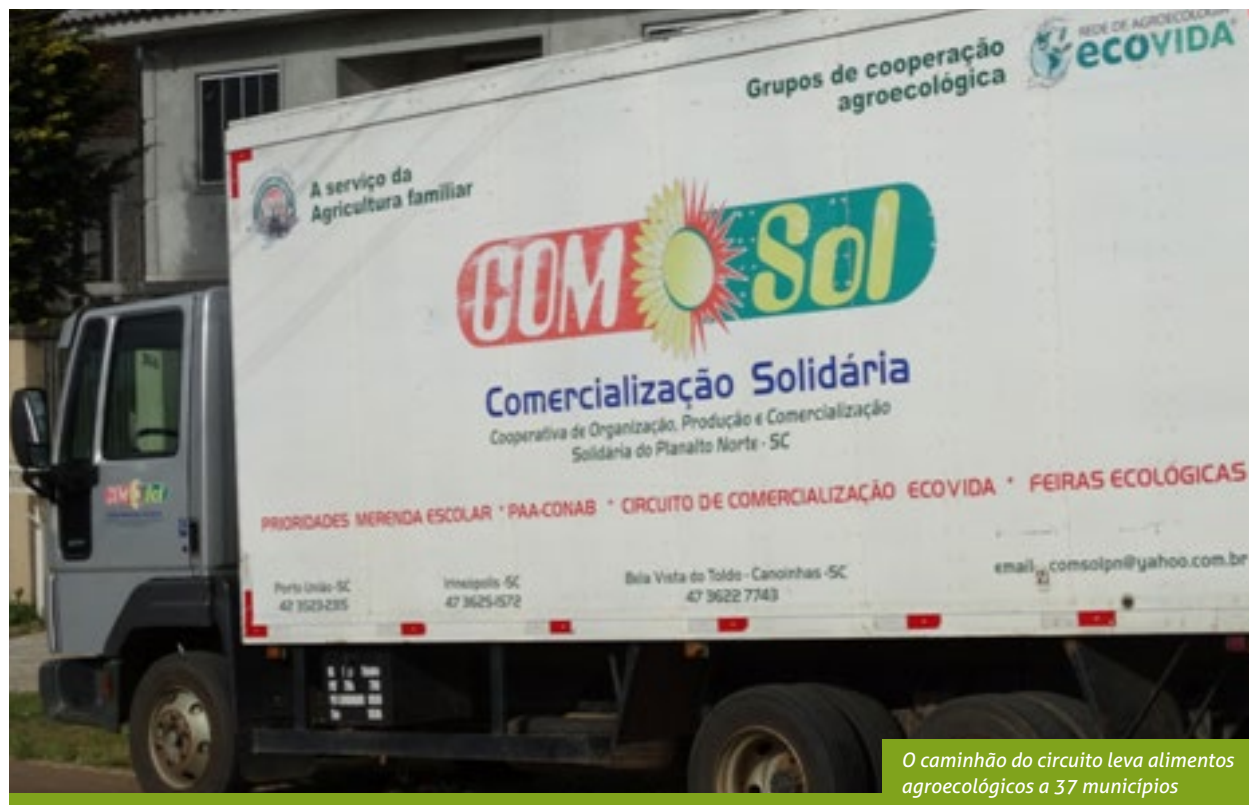
O caminhão do circuito leva alimentos agroecológicos a 37 municípios