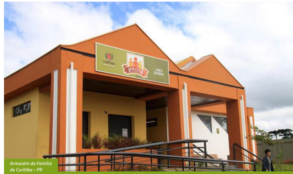
Armazém da Família de Curitiba – PR

Por uma questão de logística, nos armazéns não há setor de hortifrutigranjeiros, porém a agricultura familiar já fornece alguns alimentos para o programa, como o leite e cereais. Essa ausência é de alguma maneira compensada por um outro programa, Sacolão da Família, onde são comercializadas frutas e hortaliças a preços únicos, 40% inferiores aos do mercado.