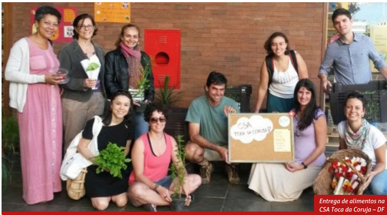
Entrega de alimentos na CSA Toca da Coruja – DF