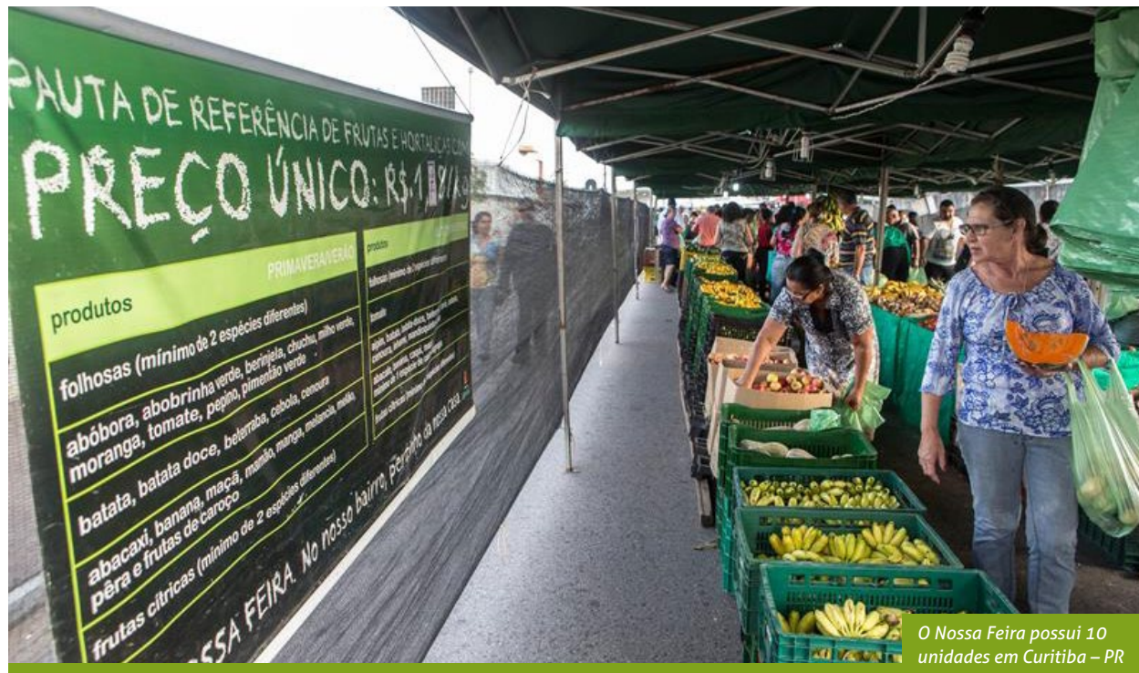
O Nossa Feira possui 10 unidades em Curitiba – PR